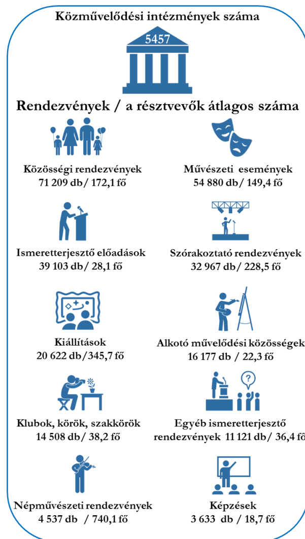
3. ábra: Közművelődési intézmények és közművelődési tevékenységek, 2015

Forrás: Infoszolg/KSH , Közművelődési intézmények és rendezvények (2000–) Piktogram: thenounproject