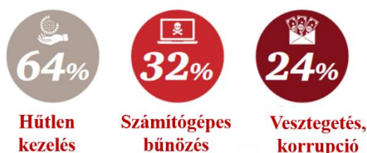
2. ábra: A három leggyakoribb gazdasági bűncselekmény a világon

A nemzetközi gazdasági bűncselekmények felderítésének gyakorlatában a legutóbbi eredmény a Bizottsági javaslatra , 2017 júniusában, 20 tagállam megerősített együttműködési keretében létrehozott Európai Ügyészség (EPPO) . Az Európai Főügyészből és a tagállami ügyészekből álló kétszintű kollégium jogosult lesz a nyomozások és vádhatósági eljárások lefolytatására uniós csalások és az Unió pénzügyi érdekeit sértő, egyéb bűncselekmények esetében. Magyarország nem csatlakozott az együttműködéshez.