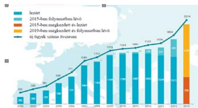
1. ábra: Eurojust ügyek száma (2002-2015)