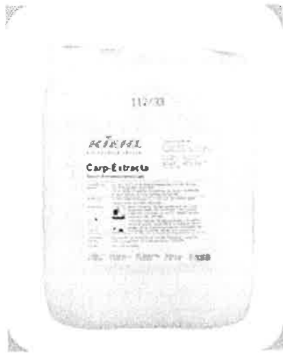
CARP-EXTRACTA tisztítószer CARP-EXTRACTA 10L - j 60 02 10

A Carp-Extracta intenzív hatású tenzid- és polimer tartalmú, erősen fékezett habzású. A szennyeződést gyorsan kioldja és az extrakciós eljárás során eltávolítja. A szőnyegben maradó nedvesség a tisztítószerrel polimer agglomerátumot képez, mely száradás után felszívható. A Carp- Extracta a házi poratka és a zavaró szagok ellen hatásos. A termékben található tenzidek 90%-a biológiailag lebomló. Minden színtartó és nedvességálló szőnyegen alkalmazható.