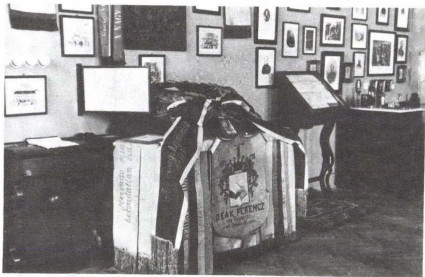
4. Részlet az ún. „Deák-szobá”-ból. (Ltsz. MMM 3885/1957. fk.)