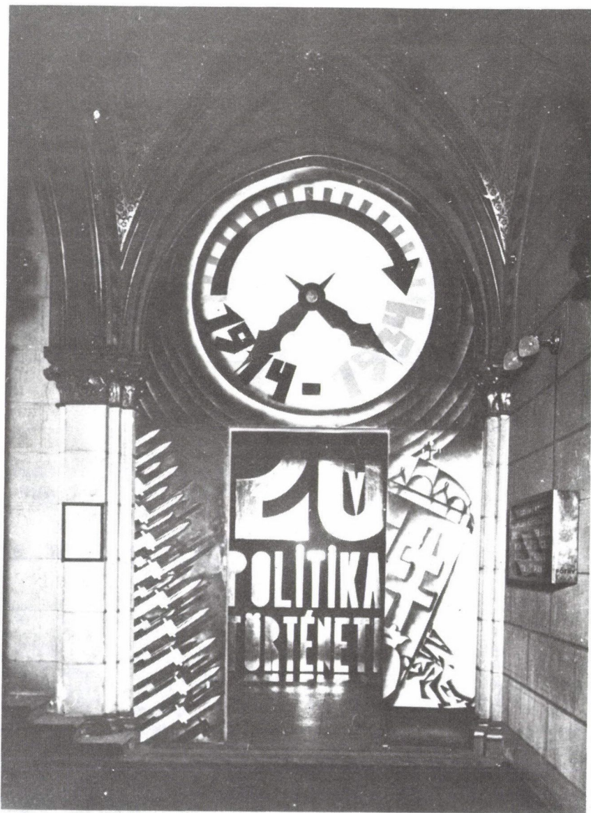
5. Az Országgyűlési Múzeum bejárata a „Húsz év politikai története” című időszaki kiállítás idején. (Ltsz. MMM 69.660.)