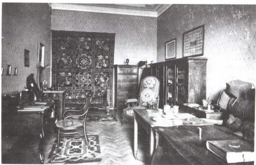
3. Deák Ferenc utolsó lakásának rekonstrukciója. (Ltsz. MMM 3883/1957. fk.)