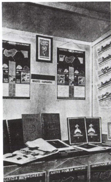
7. A „Revíziós szoba” részlete a „Húsz év politikai története” című kiállításból.