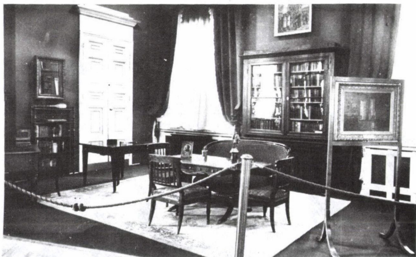
2. Enterieur Kossuth Lajos turini lakásának bútorából. Előtérben Parlaghy Vilma Kossuth lakását ábrázoló festménye. (Ltsz. MMM 3054/1957. fk.)