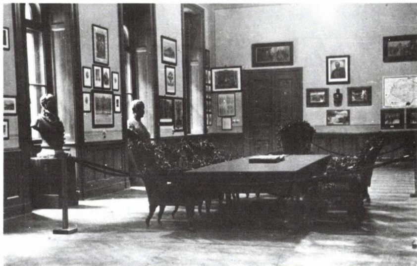
1. Az első független magyar minisztertanács karosszékei az Országgyűlési Múzeum 1929-ben megnyitott állandó kiállításán. (Ltsz. MMM 3872/1957.fk.)